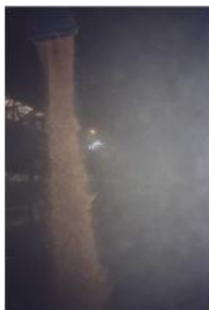
Ohne SILO-RAM ®

SILO-RAM®, ist die beste angewendete Methode zur Bekämpfung von Staubproblemen bei: